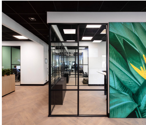
PPC Wijk bij Duurstede