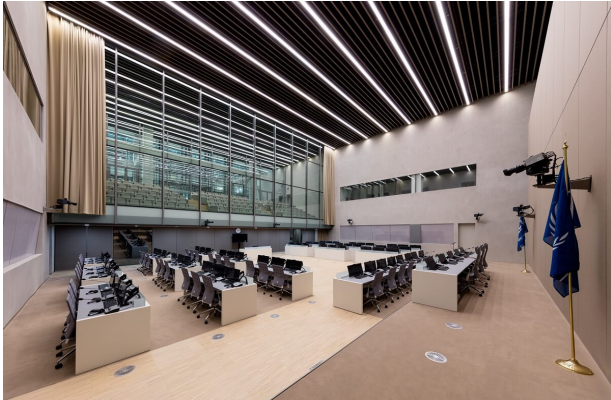
International Criminal Court - Den Haag